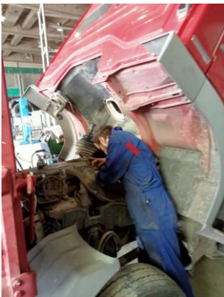
Wykonywanie czynności kontrolnych ( kierowca – mechanik )

Wyjazd na praktyki zagraniczne nie ograniczał się jedynie do zdobywania kwalifikacji zawodowych, ale był też okazją do nauki języka,