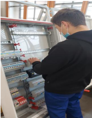
Montaż szaf elektrycznych ( elektryk )

Uczniowie zdobywali cenną wiedzę i umiejętności, które wzbogaciły ich kwalifikacje zawodowe oraz podniosły szanse na rynku pracy nie tylko w Polsce, ale i całej Europie.