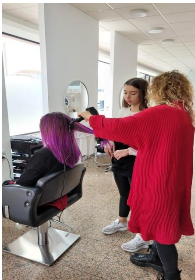
Zdobywanie nowych umiejętności w zawodzie fryzjer

Młodzi adepci zdobywali i doskonalili swoje umiejętności zawodowe. Nowe techniki strzyżenia i farbowania, przepisy na regionalne potrawy portugalskie, sposoby napraw aut różnych marek, to tylko niektóre z doświadczeń, których zdobyciem mogą się pochwalić nasi uczniowie. Portugalscy mentorzy byli zachwyceni wiedzą i zaangażowaniem swych podopiecznych z Polski.