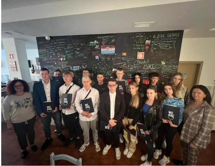
Uczestnicy – grupa II

Młodzi adepci zdobywali i doskonalili swoje umiejętności zawodowe. Nowe techniki strzyżenia i farbowania, przepisy na regionalne potrawy portugalskie, sposoby napraw aut różnych marek, to tylko niektóre z doświadczeń, których zdobyciem mogą się pochwalić nasi uczniowie. Portugalscy mentorzy byli zachwyceni wiedzą i zaangażowaniem swych podopiecznych z Polski.