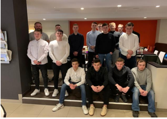
Uczestnicy - I grupa

Uczniowie zdobywali cenną wiedzę i umiejętności, które wzbogaciły ich kwalifikacje zawodowe oraz podniosły szanse na rynku pracy nie tylko w Polsce, ale i całej Europie.