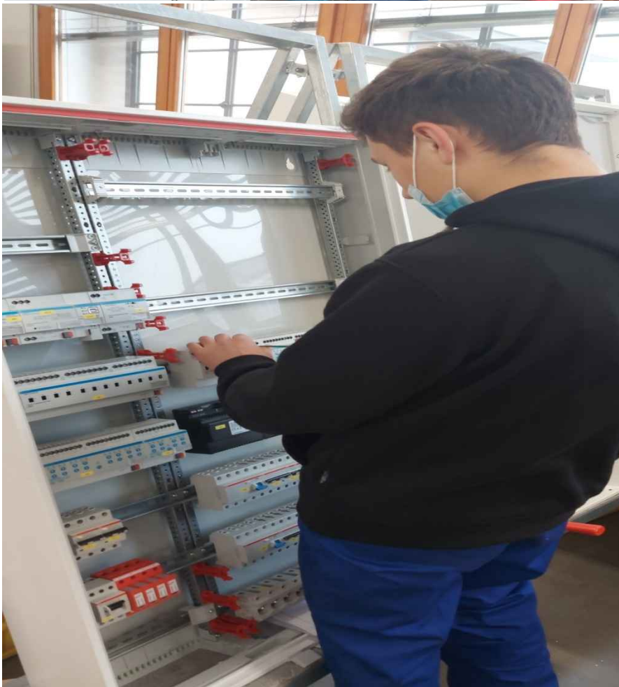
Montaż instalacji elektrycznej oraz szaf sterujących elektroniką i elektryką w budynkach przemysłowych