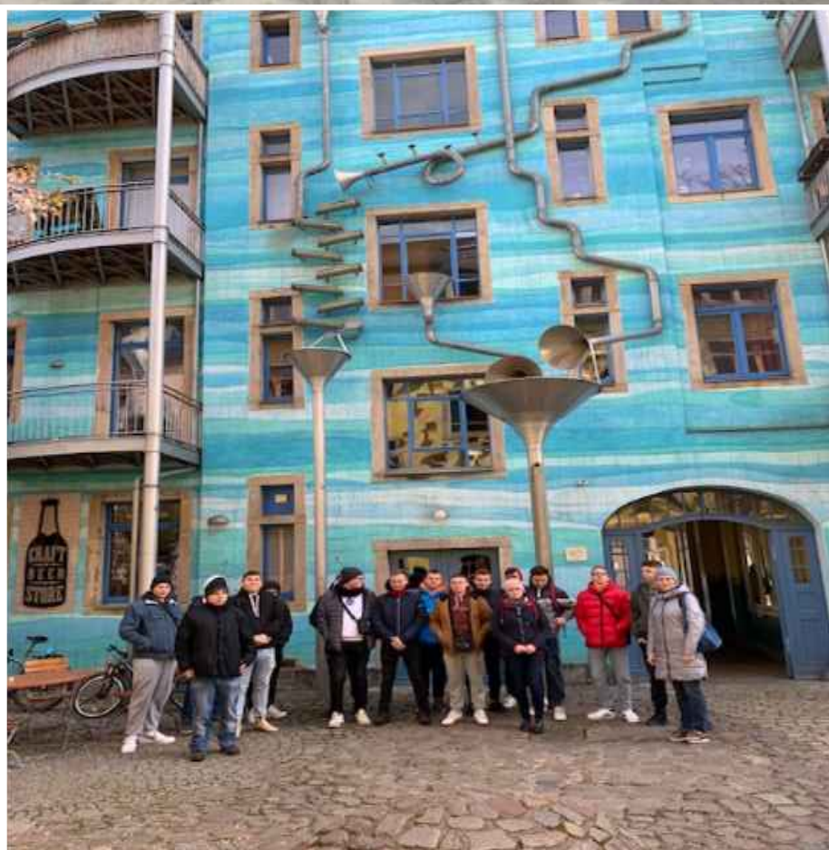
Realizacja programu kulturowego