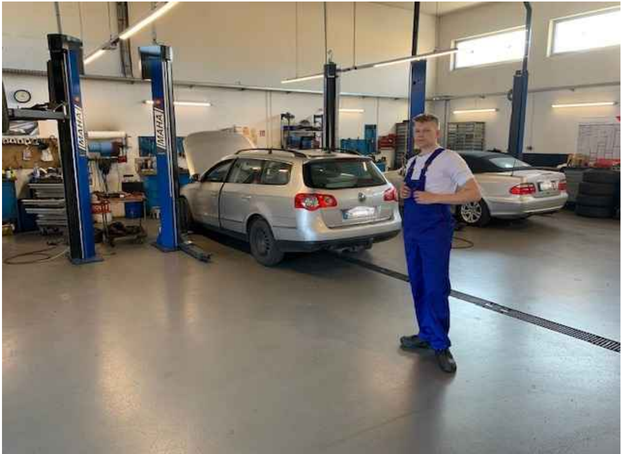
Pierwszy dzień praktyk